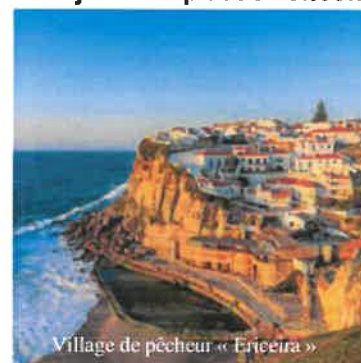
Village de pêcheur « Ericeira »

Petit déjeuner à l'hôtel et départ pour une excursion à la journée avec le guide local vers ERICEIRA, une jolie petite ville de pêche portugaise . Elle représente à merveille une sorte de fusion entre le patrimoine du Portugal et l'ambiance « surfeur » décontractée. Des petites baraques de pêcheur se trouvent juste à côté des bars et des cafés à la mode. Puis arrêt dans le petit village de SOBREIRO pour la visite d'une reconstruction d'un village portugais en miniature (José Franco), qui regroupe des maisons, des fermes, une cascade et un moulin à vent, tous minutieusement recréés - Déjeuner « Plat de poisson » dans un restaurant - Après-midi, route vers MAFRA pour la visite du Palais National, le plus vaste du Portugal, à la découverte d'impressionnantes collections de tableaux, meubles et autres œuvres d'art – Continuation vers ABRANTES ou environ – Installation à l'hôtel, dîner et logement