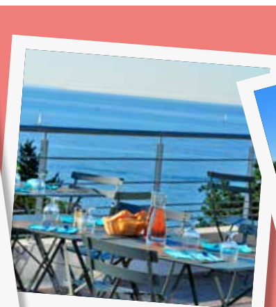
La terrasse du restaurant